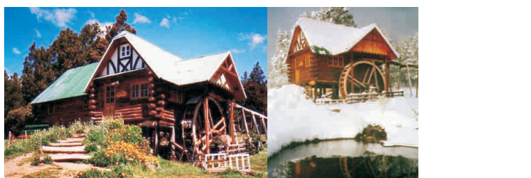
C ascatas Nant & Fall

Molino Museo Nant Fach, donde se ve un molino harinero en funcionamiento como el que usaban los antiguos colonos.