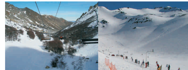
Centro de esquí La Hoya a (Esquel) Ski La Hoya (Esquel)