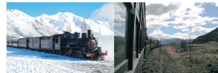
El tr adicional tren "El Trochita" (Esquel) O tr adicional trem "El trochita" (Esquel)

Circuitos y/o lugares para visitar Circuitos e/ou lugares para visitar